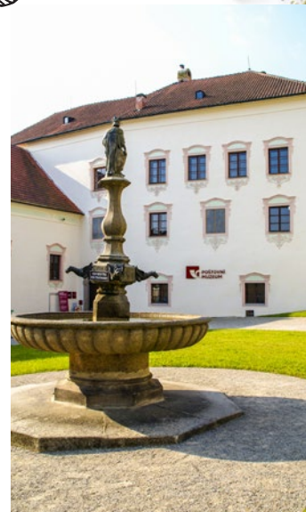
Poštovní muzeum Nové mlýny 2, Praha 1 3. 4. – 7. 7. 2019 otevřeno úterý – neděle 9–17 h www.postovnimuzeum.cz